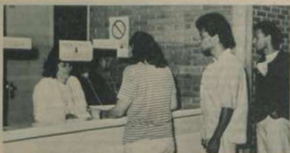
A recepção única está instalada na entrada intermediária do edifício onde funciona a Divisão de Saúde.