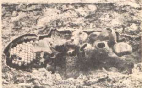
Uma colméia pode ser bastante populosa, como esta da foto.

vários anos, produzindo cerca de 15 por dia, número bem inferior à produção de ovos da Apis mellifera , que chega a produzir cerca de dois mil em 24 horas. As larvas se localizam em um conjunto de células de cria formadas por cerúmen (mistura de cera e resina vegetal que proporciona boa maleabilidade). O cerúmen é utilizado pelos índios como material de vedação, na montagem de flechas e em outros artigos de uso cotidiano.