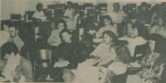
Professores de diversas regiões do Estado encontram-se em Viçosa para o curso de especialização.

Cerca de uma centena de professores que atuam no ensino de terceiro grau em faculdades isoladas e em escolas de segundo grau da rede pública do Estado encontram-se, neste sábado, 8, o primeiro módulo do curso de especialização "lato sensu" em Língua Portuguesa, Ciências (Biologia, Física e Química) e Matemática, ministrado no Centro de Ensino de Extensão por Docentes da UFV. O objetivo é oferecer aos participantes uma reciclagem, com a duração de 360 horas, contribuindo para a melhoria do nível do ensino.