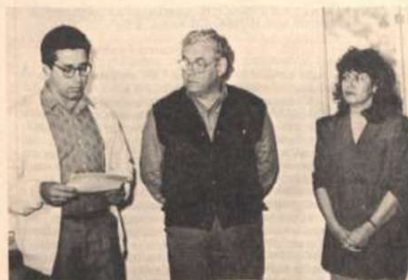
O novo diretor-presidente faz seu discurso de posse.