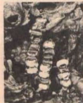
Favo de larvas.

A caga-fogo ( Oxytrigona taenata ) produz uma secreção ciliada em suas glândulas mandibulares, causando uma irritação bastante séria ao morder a pele de quem perturba seus ninhos. Outras espécies, completamente mansas, se defendem indo para o interior de seus ninhos quando molestadas. Nesse caso, a inacessibilidade do ninho se constitui na principal defesa da espécie. Outras, ainda, constroem seus ninhos dentro dos formigueiros, o que possibilita uma defesa "por tabela".