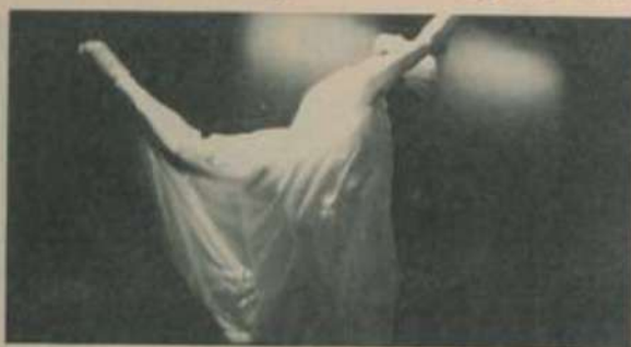
Plasticidade, dança, música: "Planeta Terra".

Amanhã à noite, a partir das 21 horas, no Centro de Vivência da Universidade Federal de Viçosa, o Grupo Extase de Dança apresentará o espetáculo "Planeta Terra", o mesmo apresentado na abertura da Sessão Solene do II Simpósio Internacional de Estudos Ambientais em Florestas Úmidas (FO-