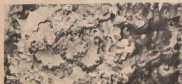
Parte do interior de uma colméia: à direita, os depósitos de mel.