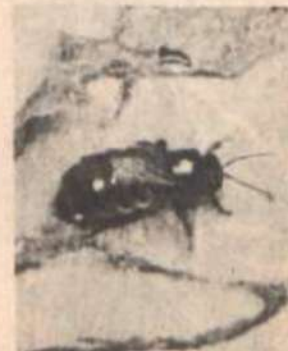
A abelha rainha.