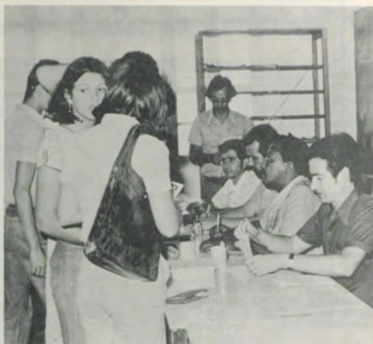
As inscrições ao vestibular.

Valho-me da oportunidade para reiterar-lhe a expressão de meu mais alto apreço.»