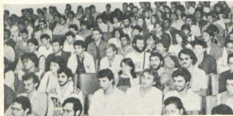
Os estagiários do Programa Gilberto Melo.