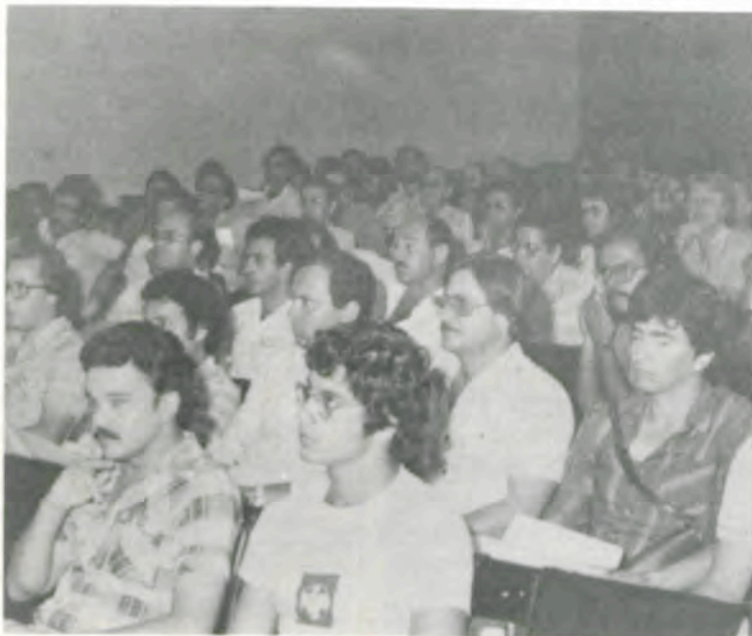
Eles vão construir um novo bairro na cidade.

onará um considerável aumento de imóvel, para locação, e uma conseqüente baixa nos aluguéis.