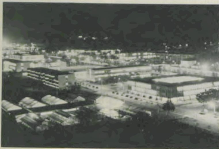
Sempre caminhando para novas conquistas.

Na atualidade, ela se considera um instrumento racional para o aumento da produtividade dos sistemas econômicos, pois possui uma posição crítica e criadora, que a torna uma instância de reflexão sobre as condições e sentido de desenvolvimento. Ela entende que deve contribuir para o desenvolvimento econômico, como