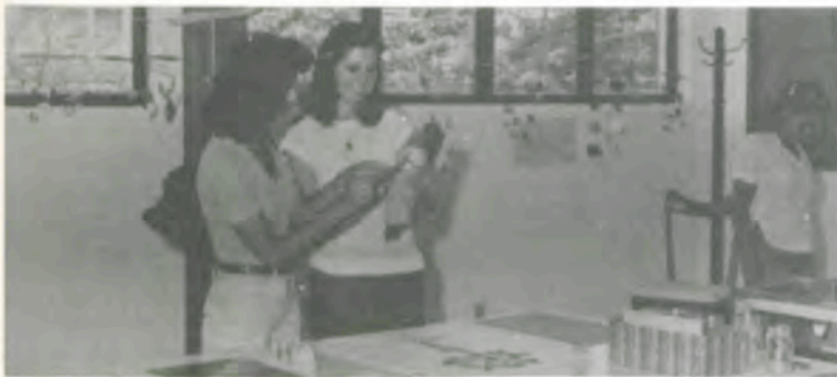
A mostra de brinquedos e jogos.

O Laboratório de Desenvolvimento Humano do Departamento de Economia Doméstica expôs, nos dias 29 e 30 de novembro, os trabalhos práticos de confecção de brinquedos e jogos executados por suas estagiárias.