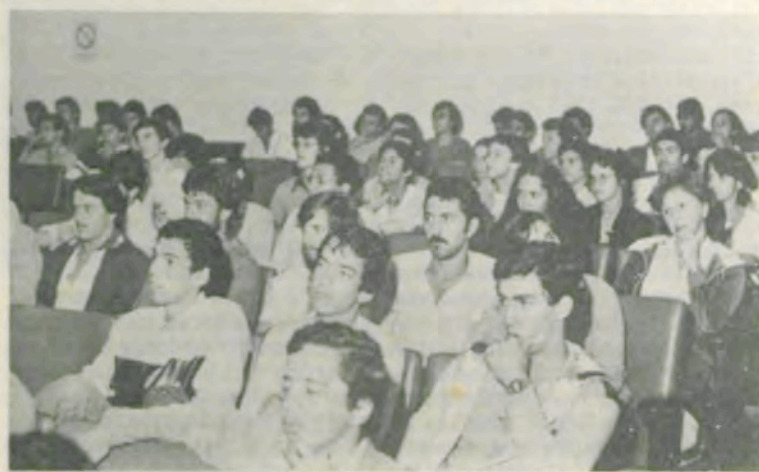
Vista parcial do plenário da Semana.

Com a participação de mais de 200 estudantes, foi realizada, no período de seis a 10 do corrente, a VI Semana Acadêmica de Zootecnia, promovida pela Universidade Federal de Viçosa (UFV), através do Conselho de Extensão, Centro de Ciências Agrárias, Departamento de Zootecnia do Centro de Ciências Agrárias, Centro Acadêmico de Zootecnia e Associação Mineira de Estudantes de Zootecnia (AMEZ) — Secretaria Executiva de Viçosa.