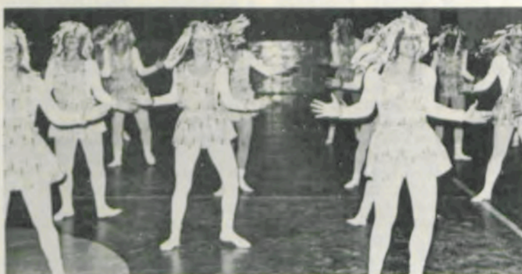
O número de dança "Emília" foi um dos mais aplaudidos pelo público.