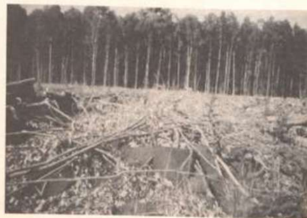
Formigueiro em reflorestamento de eucalipto.

A quantidade de focos de ocorrência, a dimensão do pior foco, o nível de comprometimento da folhagem e sua posição na copa, a quantidade de formigueiros, o tamanho e a predominância das colônias, a quantidade de árvores danificadas, a quantidade de "olheiros" e a idade da floresta são alguns indicadores que