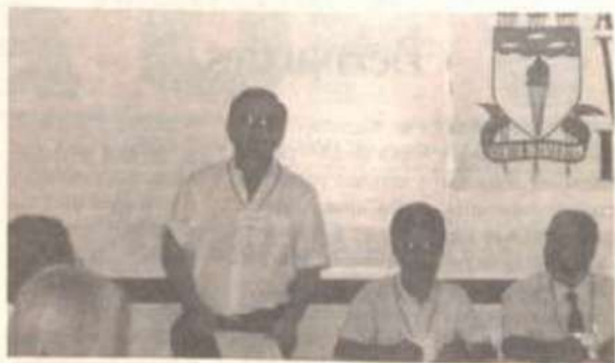
O representante da UFV, em pé, fala durante uma das sessões do evento.

Realizou-se em Maceió, no início deste mês, a II Reunião Nacional de Trabalho do Fórum de Pró-Reitores de Assuntos Comunitários. O principal ponto da pauta foi a assistência estudantil em todas as instituições federais de ensino brasileiras. Também foram discutidos pontos expressivos como moradia estudantil e restaurantes universitários.