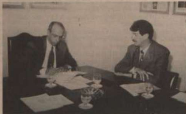
Assinatura do termo aditivo na Sala de Reuniões da Reitoria.

O Sistema de Rádio e Televisão (RTV) da Universidade Federal de Viçosa assinou acordo com a Empresa de Assistência Técnica e Extensão Rural de Minas Gerais (Emater-MG), para a produção e veiculação de programas voltados para os produtores rurais da região.