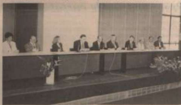
A mesa que presidiu a solenidade de abertura do seminário.

Logo após o término do seminário, os visitantes foram convidados a participar do plantio de uma árvore em frente à Biblioteca Central da UFV, como lembrança do encontro. O encerramento da Reunião Internacional aconteceu no sábado. No dia seguinte, os visitantes regressaram aos Estados Unidos.