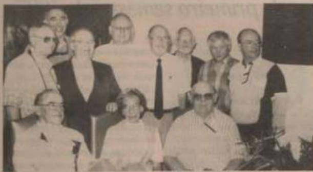
Alguns ex-alunos da Universidade Purdue reunidos no CCA.

Encontro reúne ex-alunos das duas Universidades em Viçosa