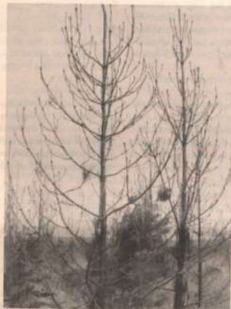
Árvores atacadas por formigas cortadeiras.

Deve-se, ainda, considerar a possibilidade de diminuição dos riscos à saúde dos trabalhadores que lidam com os formicidas, dos riscos de transporte e armazenamento e daqueles provocados pelo descarte dos restos e das embalagens dos produtos, além dos recursos financeiros que poderiam ser economizados com a ausência de tais riscos.