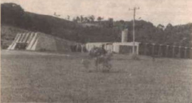
Instalações do Centreinar no campus da UFV

O Centreinar vem, desde sua criação em 1976, especializando-se em