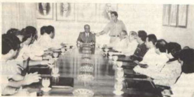
Solenidade de assinatura do convênio.

Dentre as atribuições definidas pelo Convênio, estão os seguintes pontos: promover debates, palestras, reuniões e cursos de treinamento para técnicos e funcionários do município, estudantes, professores e técnicos da UFV; propiciar estágios supervisionados para os alunos dos diversos cursos da UFV; e elaborar projeto de desen-