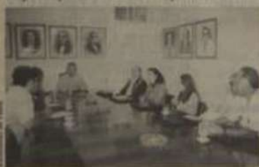
Aspecto da reunião na Reitoria.

Além da UFV, foram feitos contatos também com a Prefeitura Municipal de Viçosa, uma vez que a Fundação mantém contratos firmados com os dois tipos de entidades.