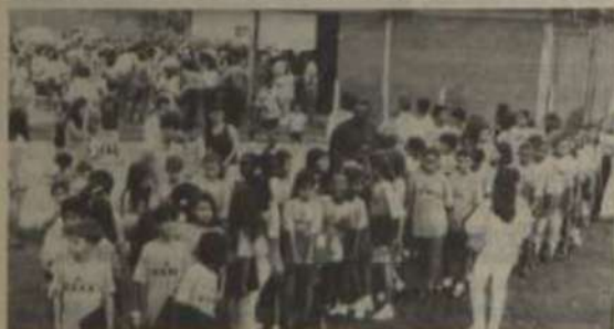
Parte do público que compareceu à festa.

Para a criançada, a atração maior - além da distribuição gratuita de pipocas e algodão doce - foi o show promovido pela equipe do Circo sem Lona, com encenações de histórias infantis.