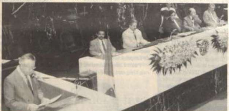
O vice-reitor da UFV agradece a homenagem recebida.

Maiores informações, pelo telefone (031) 899-2383.