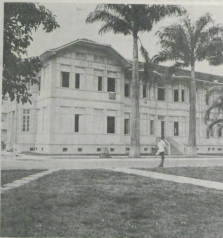
Paisagens agradáveis circundam os alojamentos masculinos.

Em 1979, foi criado o Laboratório de Desenvolvimento Humano, para atender a crianças dos vários níveis sócio-econômicos, na faixa de três a seis anos de idade.