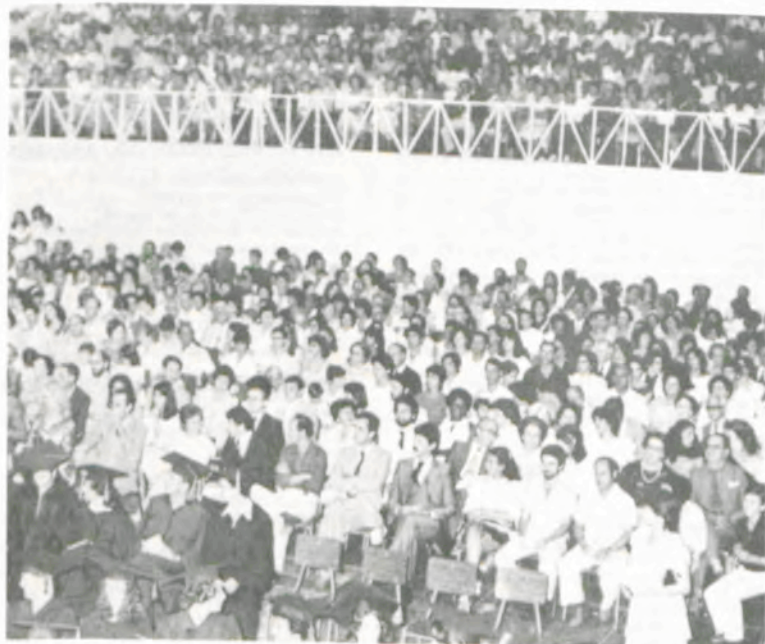
Parte do público presente à cerimônia.