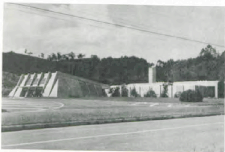
A sede do Centreinar na UFV

O número de participantes é de 30, por curso, que irão receber certificados, pelo seu aproveitamento. As aulas serão ministradas na sede do Centreinar, na Universidade Federal de Viçosa, sendo que as taxas de inscrição custam: Cr$ 8.900,00 (nível superior) e Cr$ 7.500,00 (nível médio). As reservas podem ser feitas pelo telefone: (031) 891-2270, Ramal-15, ou pela Caixa Postal n.º 375 — CEP — 36 570 — Viçosa — MG.