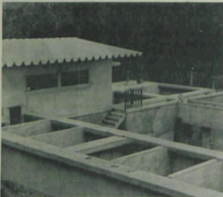
A Casa de Química e os filtros rápidos.