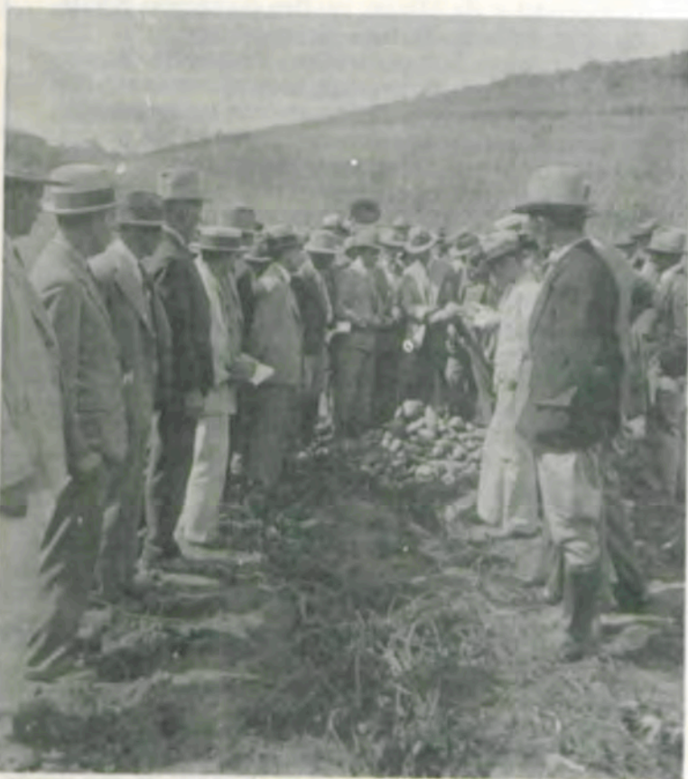
Aula prática na Semana do Fazendeiro em seus primeiros anos.

A Universidade Federal de Viçosa, mantendo a sua tradição no campo da Extensão Rural, estará promovendo, no período de 14 a 18 de julho próximo, a sua 52.ª Semana do Fazendeiro, que oferecerá este ano, como inovação, atividades para as esposas dos participantes.