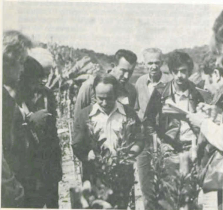
Aula prática na Semana do Fazendeiro do ano passado.