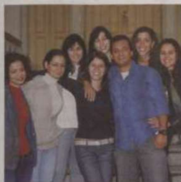
ARQUITETURA E URBANISMO