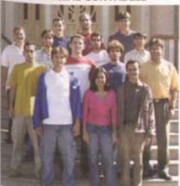
ENG. AGRÍCOLA E AMBIENTAL