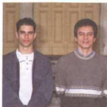
CIÊNCIA DA COMPUTAÇÃO