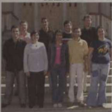
ENGENHARIA DE PRODUÇÃO