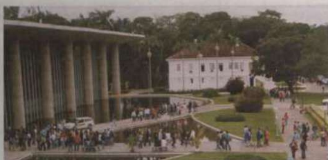
Os estudantes lotaram o campus durante o evento "A Graduação na UFV"

O valor do Manual do Candidato é de R$ 10,00 (dez reais), que poderá ser adquirido nas agências credenciadas dos Correios. As provas serão realizadas nos dias 28, 29 e 30 de dezembro de 2004, em 25 cidades brasileiras. Serão oferecidas 1.790 vagas, em 35 cursos, em diversas áreas do conhecimento.