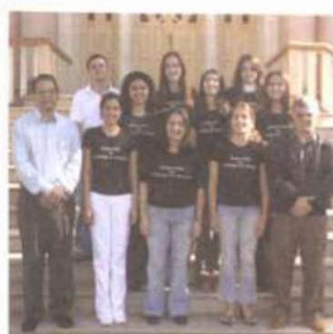
CIÊNCIA E TEC. DE LATICÍNIOS