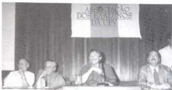
As reuniões anuais da AEA são muito concorridas

Desde 1968, a Associação contempla, com a Medalha da Ordem do Mérito do Ex-Aluno, um associado que tenha se destacado na profissão ou contribuído, de maneira especial, para o