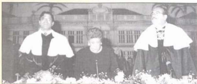
Autoridades presentes à solenidade de Colação de Grau