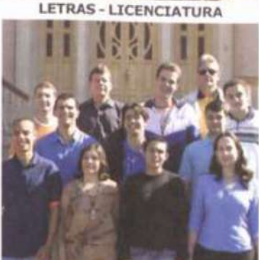
ADM - HAB. EM ADM. DE COOPERATIVAS