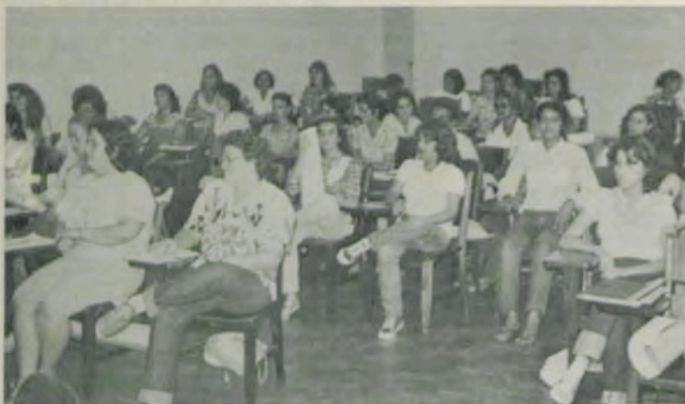
As participantes do curso.