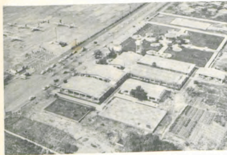
Vista parcial da sede do "Campus" Avançado de Altamira.