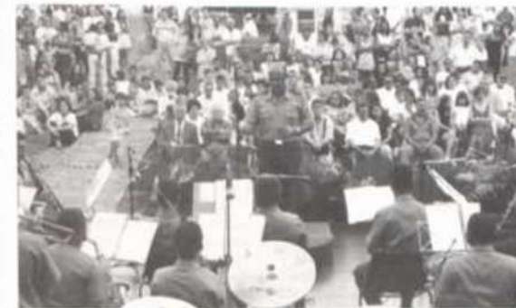
Apresentação da Banda de Música da 4ª Brigada de Infantaria Motorizada do Exército.

À noite, no Centro de Vivência, aconteceu a Sessão Solene de entrega das medalhas José Valentino da Cruz, Bello Lisboa e Peter Henry Roffs e, em seguida, a outorga do título e grau de Doutor “Honoris Causa” a Dom Paulo Evaristo Arns.