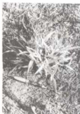
Detalhe da rebrota de capim-gordura.

O acompanhamento periódico da sucessão ecológica deverá fornecer informações importantes para o entendimento da dinâmica da vegetação em áreas da Zona da Mata Mineira degradadas pelo fogo.