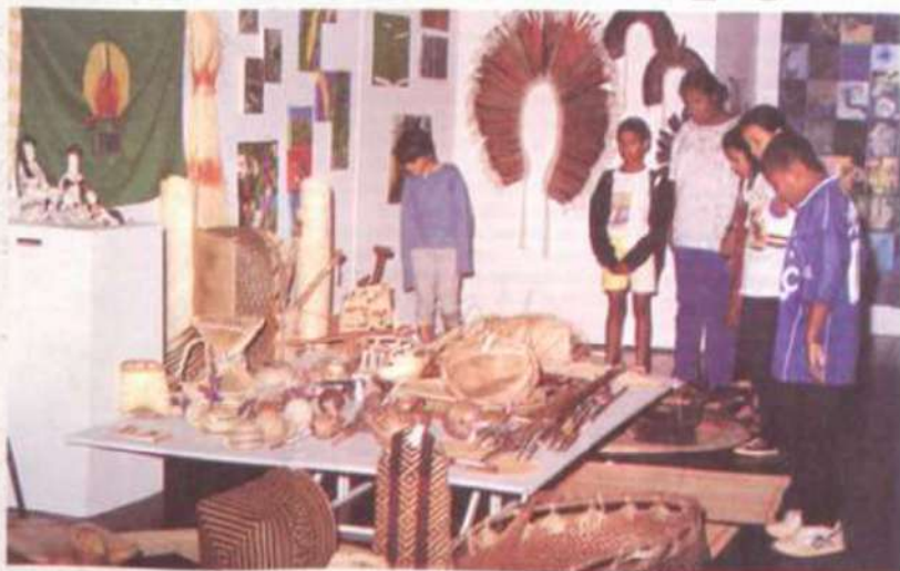
A mostra atraiu um grande público ao Centro de Vivência.

Uma das mais importantes manifestações artísticas da atualidade, a mostra Terra Brasilis, Terra Papagalli, foi montada no Centro de Vivência da UFV, no período de seis a 19 deste mês, reunindo em oito painéis temáticos cerca de mil trabalhos de 200 artistas e artesãos do Distrito Federal.