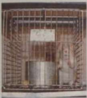
Animal usado na pesquisa.

São compostos puros, isolados de plantas, que têm sido capazes de reduzir em mais de 60% os níveis de gordura no sangue desses animais e podem, no futuro, tornar-se medicamentos no tratamento de doenças cardíacas e do diabetes, pois tendem a agir como preventivos.