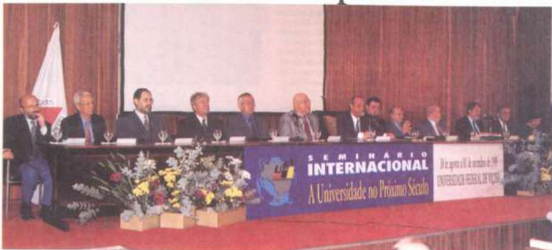
Mesa de honra da cerimônia de abertura.