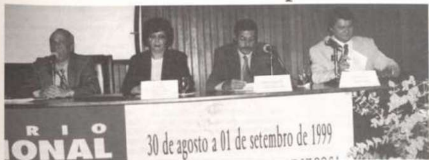
Os reitores discutem os desafios e as perspectivas das universidades no próximo século.

Discutir, refletir e reavaliar o papel da universidade – especialmente a pública – no contexto social foram os objetivos do seminário internacional “A Universidade no Próximo Século”, realizado na UFV no período de 30 de agosto a 1º de setembro, dentro das comemorações dos 73 anos de existência da Universidade. A promoção foi da Reitoria, em parceria com a Pró-Reitoria de Planejamento e Orçamento e a Coordenadoria de Comunicação Social da UFV.