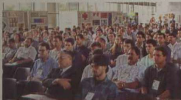
O evento reuniu participantes de diversos estados brasileiros.

Dentro desta linha de pesquisa, já foram produzidas cinco teses de mestrado, e outros trabalhos estão sendo orientados, num total de cinco de mestrado e três de doutorado.