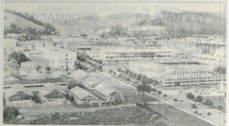
Aspecto do «campus» universitário, em sua parte central.

Traga lápis n.º 2 ou 2B, caneta esferográfica, borracha, cédula de identidade, comprovante de inscrição e nada mais.