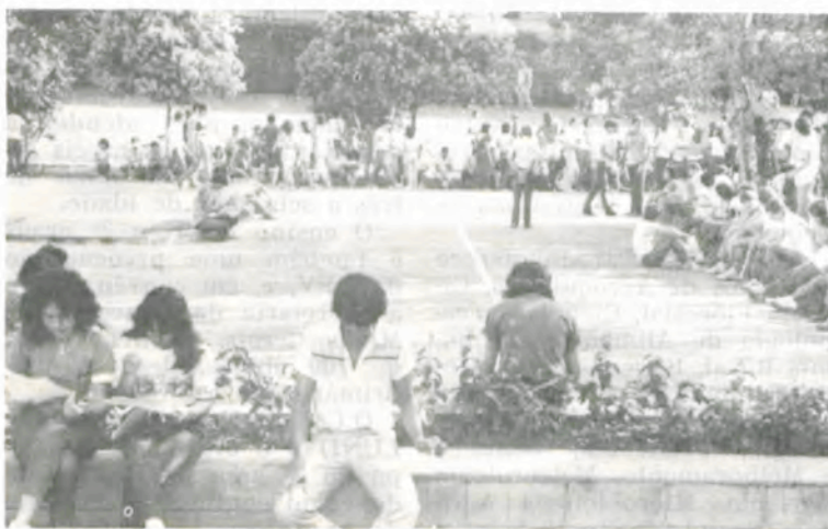
Vestibulandos após uma das provas, no ano passado.