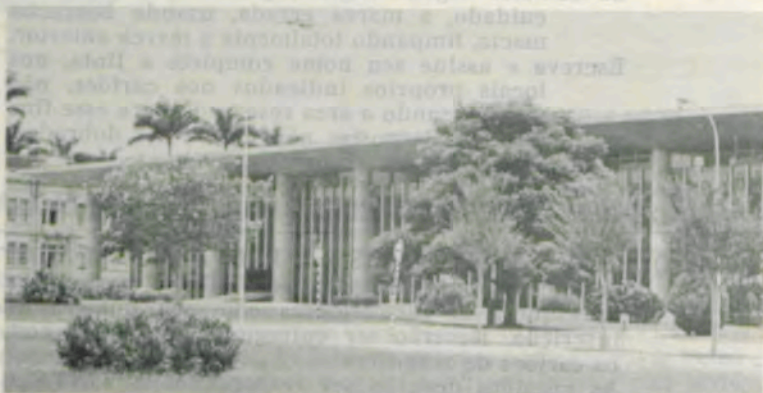
O Centro de Vivência, vendo-se ao fundo o Edifício Arthur da Silva Bernardes.

Todos os anos a UFV patrocina e/ou realiza seminários, congressos, encontros, cursos, simpósios etc., abertos ao público local, da região e de outros Estados.