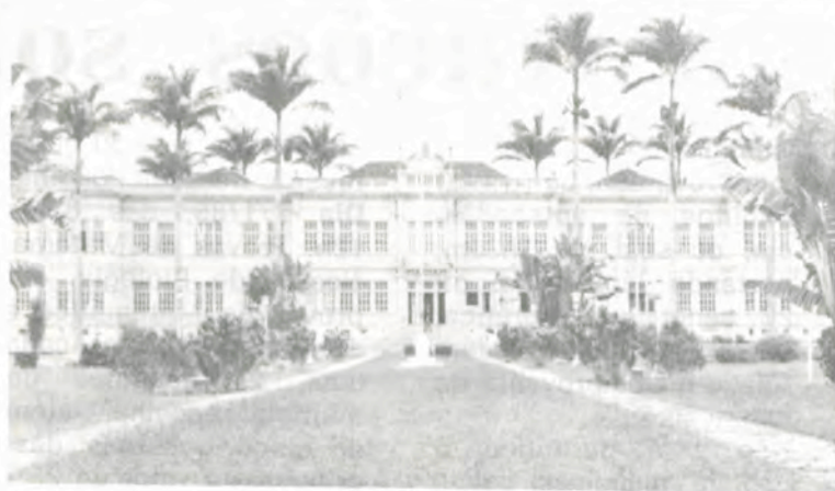
O Edifício Arthur da Silva Bernardes, um dos símbolos da UFV.

NÃO SE ESQUEÇA DO COMPROVANTE DE INSCRIÇÃO E DA IDENTIDADE