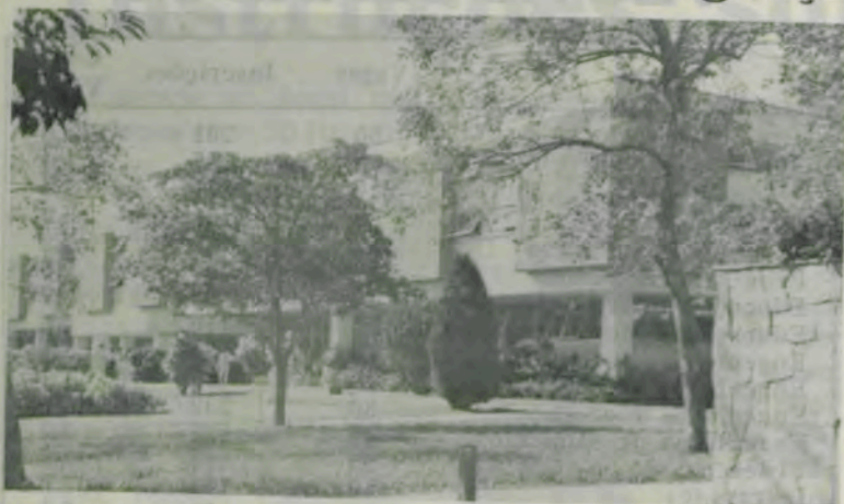
A Biblioteca Central, entre gramados e jardins.

A Universidade Federal de Viçosa (UFV) oferece hoje os seguintes cursos de graduação: Administração, Agrimensura, Agronomia, Biologia, Ciências Econômicas, Economia Doméstica, Educação Física, Engenharia Agrícola, Engenharia Civil, Engenharia de Alimentos, Engenharia Florestal, Física, Letras (com opções para Português/Inglês e Português/Francês), Matemática, Medicina Veterinária, Nutrição, Pedagogia, Química, Tecnólogo em Cooperativismo, Tecnólogo em Laticínios e Zootecnia.