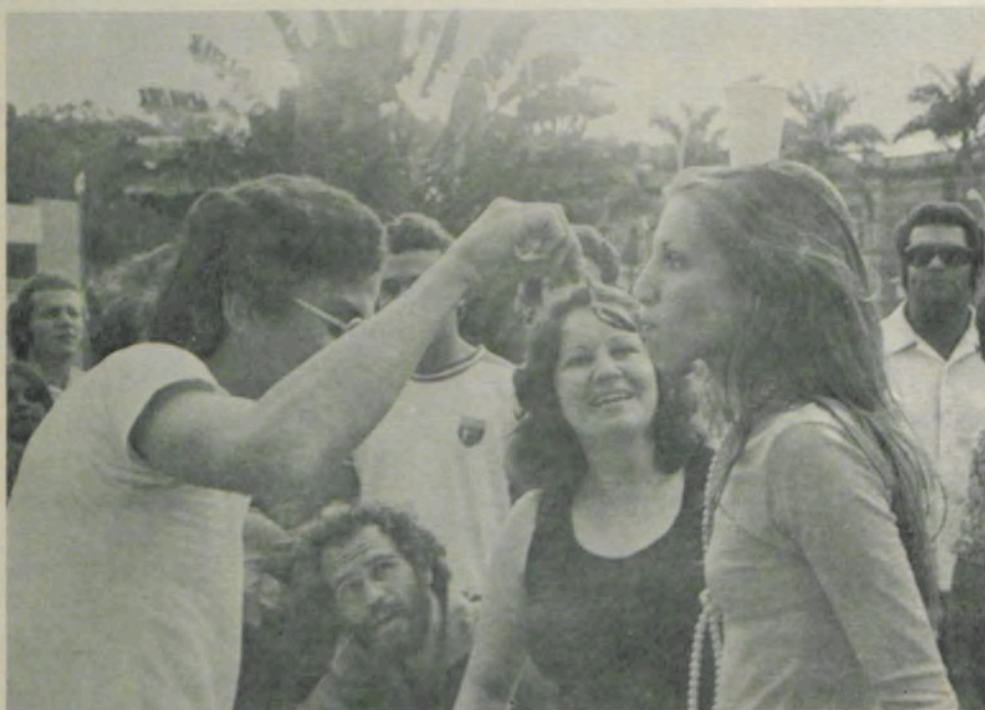
A Gincana foi disputada com muita vibração.