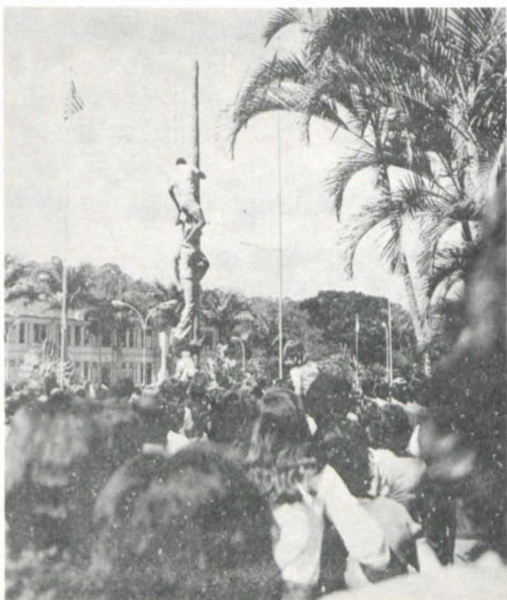
O "Pau-de-Sebo" foi uma atração que divertiu grande número de populares.