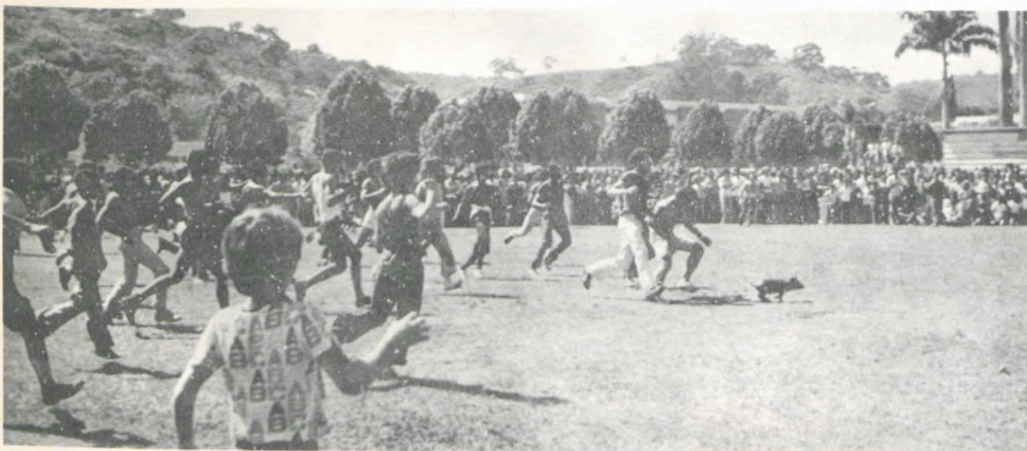
Estudantes e operários participaram da "Corrida do Porco".