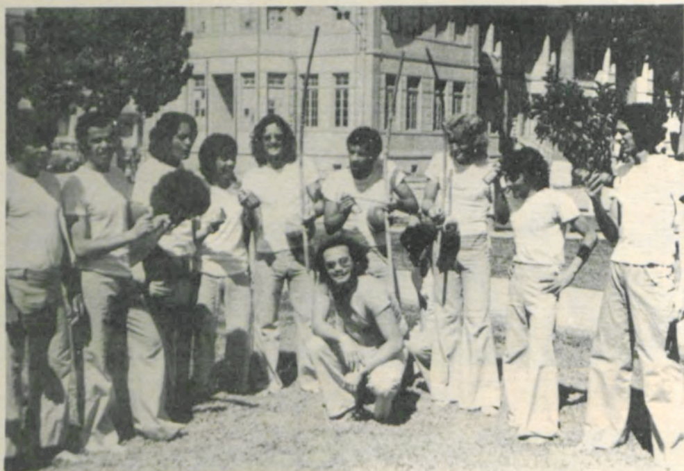
O Grupo de Capoeira, formado por estudantes da Universidade, homenageou, também, os operários.