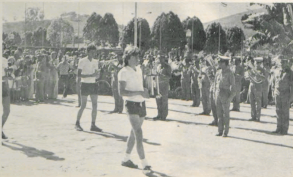
Os estudantes desfilaram ao som da Banda do 9º Batalhão da Polícia Militar de Minas.