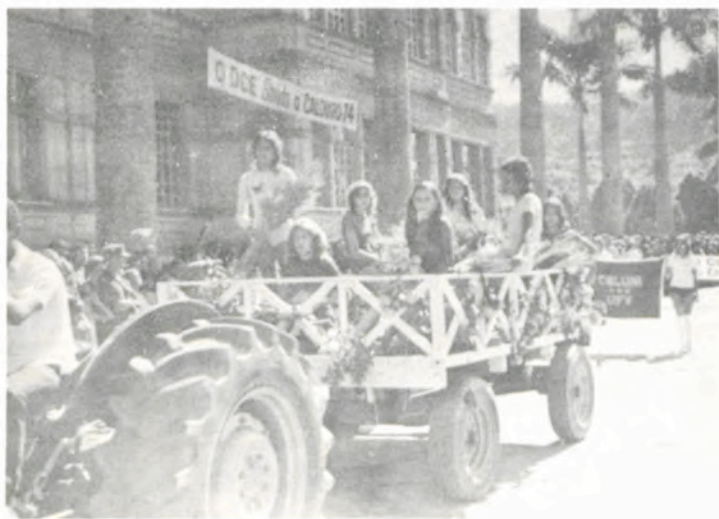
A produção agrícola teve o seu carro alegórico.