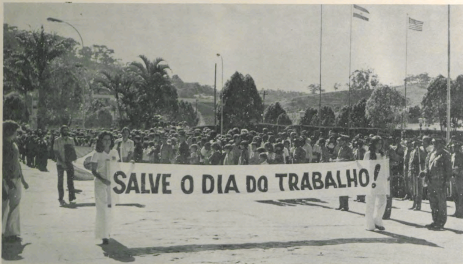
Os universitários participaram das homenagens prestadas aos operários