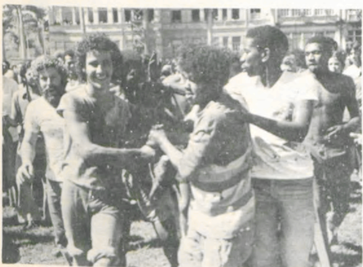
A alegria dos vencedores.