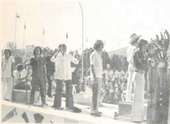
As alegorias mostraram as diversas atividades do homem em seu campo de trabalho.