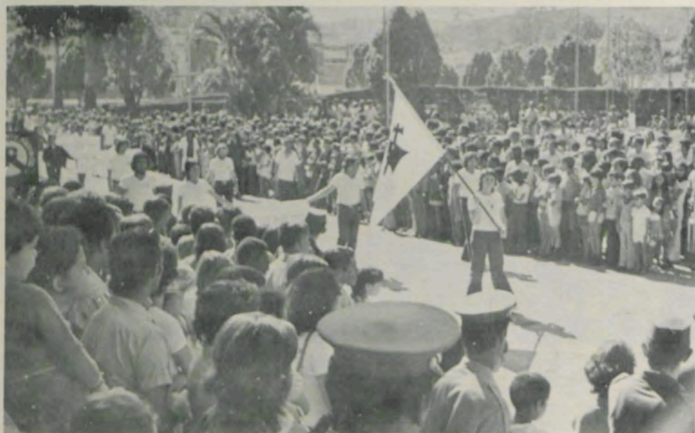
O Clube "Karrasco" participou ativamente das festividades.