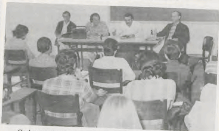
Cada um mostrou como vem conduzindo suas pesquisas.

Dividida em duas etapas, na segunda, os pesquisadores fizeram o programa de sugestões de pesquisas para aprovação, sendo que a prioridade dos trabalhos será dada em função dos recursos financeiros, humanos e materiais, e também em função da política do governo estadual.