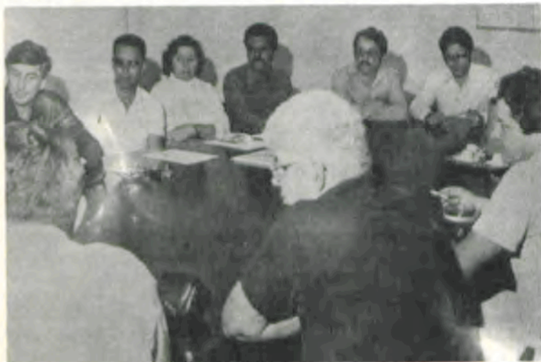
Outro aspecto da reunião na Reitoria.

Durante sua permanência na UFV, os visitantes percorreram o «campus» e alguns departamentos, com o objetivo de conhecerem maiores detalhes sobre o funcionamento da Instituição e os trabalhos de Ensino, Pesquisa e Extensão que aqui se realizam.