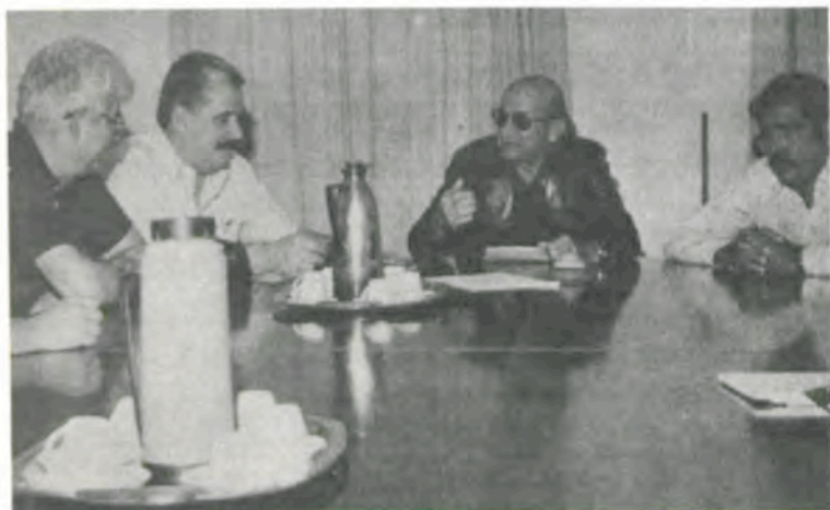
A missão do Banco Mundial na Reitoria.

A missão do Banco Mundial que visitou a Universidade Federal de Viçosa (UFV), sábado passado, num trabalho de inspeção do Programa de Desenvolvimento da Zona da Mata — Prodemata, levou uma boa impressão sobre o que se realiza, aqui, nesse setor e em outros da área de atuação da UFV. A missão chegou a Viçosa, às 11h30m, procedente de Belo Horizonte, seguindo às 15h para Ubá e Muriaé, para continuar o trabalho de verificação do andamento do Prodemata naquelas regiões.