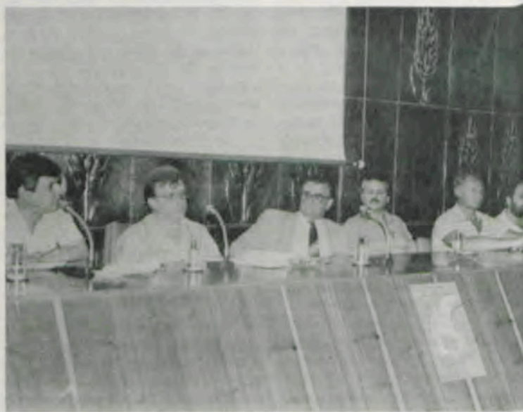
A mesa que presidiu à solenidade de abertura do encontro, no auditório do CENTREINAR.