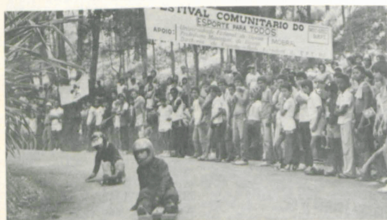
Corrida de rolimã, no Recanto das Cigarras.