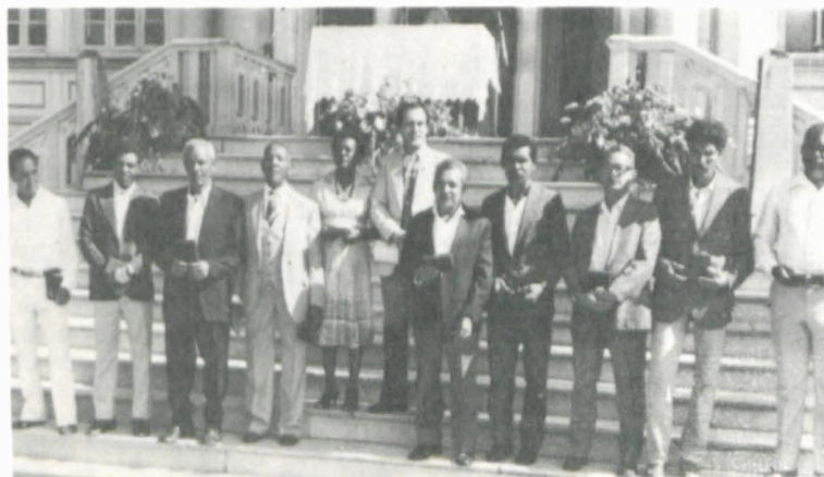
O Reitor da UFV e os servidores homenageados.