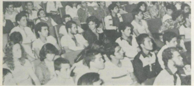
Os participantes da I Semana de Astronomia de Viçosa.

A I Semana de Astronomia de Viçosa foi realizada no período de 11 a 15 de abril, na Universidade Federal de Viçosa (UFV), com palestras que reuniram diariamente cerca de 150 pessoas no auditório do Departamento de Economia Rural.