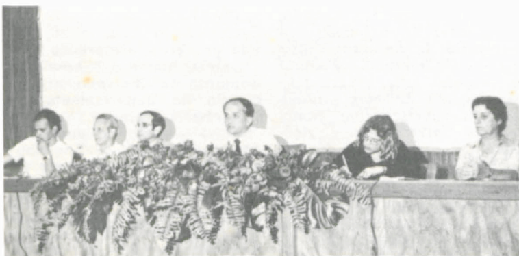
A mesa dos trabalhos, na abertura da Semana.

Termina amanhã, na Universidade Federal de Viçosa (UFV), a IV Semana de Nutrição, promovida pelo Conselho de Extensão, Centro de Ciências Biológicas e da Saúde, Departamento de Nutrição e Saúde e Centro Acadêmico de Nutrição, reunindo mais de 150 participantes para debates sobre vários temas apresentados em palestras no auditório do Departamento de Economia Rural. A programação se encerra com um encontro de professores, alunos e ex-alunos do Curso de Nutrição.